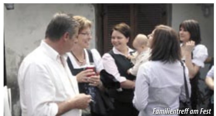
Familientreff am Fest