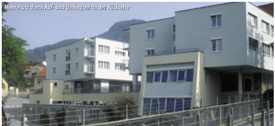
Mehr Platz durch Auf- und Umbauten an der Rückseite