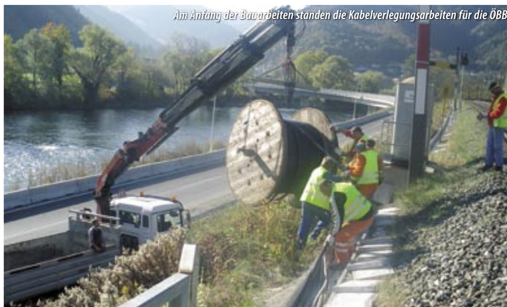
Am Anfang der Bauarbeiten standen die Kabelverlegungsarbeiten für die ÖBB

Auf das Unterbauplanum wurden ein Geotextil und ein Geogitter aus mit Kunststoff