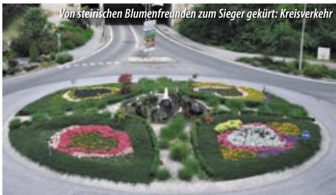
Von steirischen Blumenfreunden zum Sieger gekürt: Kreisverkehr

de. Im Rahmen der Siegerehrung des Blumenschmuckwettbewerbes kürte das Publikum die Kreisverkehrs-Anlage mit einem 1. Preis in der Kategorie ‚Steirerherz‘.