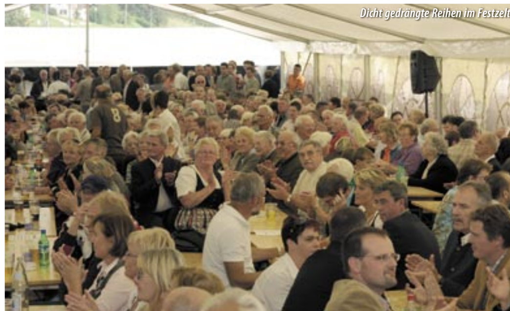
Dicht gedrängte Reihen im Festzelt