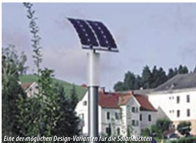
Eine der möglichen Design-Varianten für die Solarleuchten

Im Zuge der Sanierung und Neugestaltung der Josef Ortis-Straße in Mauritzen müssen auf der Seite des Volkshausparks neue Straßenleuchten installiert werden. Das Besondere daran: Geplant sind Solarleuchten – umweltfreundlich und ohne Stromkosten, gespeist lediglich durch Sonnenenergie.