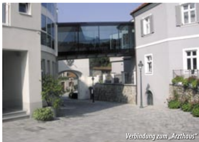
Verbindung zum „Arzthaus“