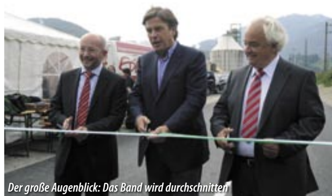
Der große Augenblick: Das Band wird durchgeschnitten

Er verzichtete in seiner kurz gehaltenen Ansprache darauf, die mühevollen Vorgeschichte dieses Vorhabens zu beleuchten, dankte hingegen demonstrativ jenen Personen, mit denen gemeinsam er die Realisierung endlich schaffte: Landeshauptmann Mag. Franz Voves, der in Etappen