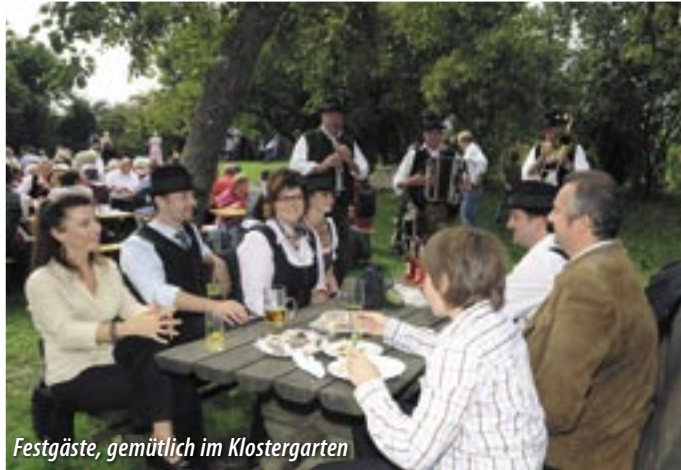
Festgäste, gemütlich im Klostergarten

Die katholische Kirche hat es seit je her verstanden, Feste zu feiern, um den Menschen Glaubensinhalte zu vermitteln und sie im Jahreslauf anhalten und nachdenken zu lassen – aber auch einfach, um sich gemeinsam zu freuen. Das Erntedankfest ist ein markantes Beispiel.