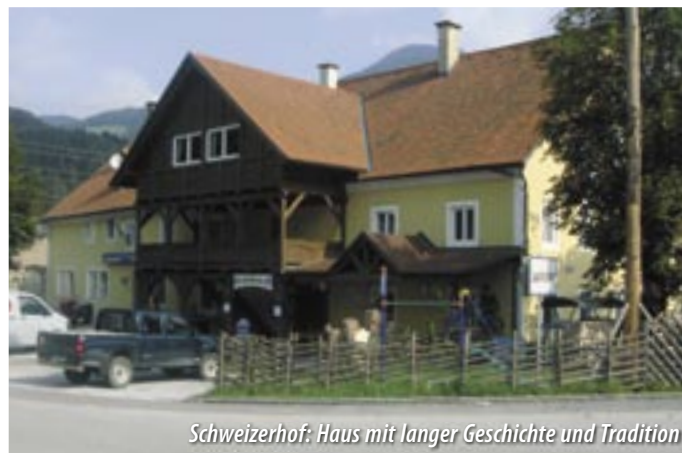
Schweizerhof: Haus mit langer Geschichte und Tradition