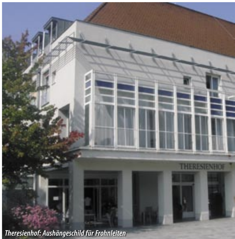
Theresienhof: Aushängeschild für Frohnleiten