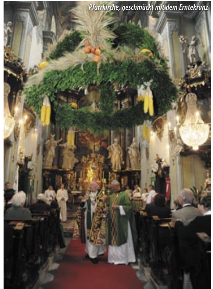
Pfarrkirche, geschmückt mit dem Erntekranz