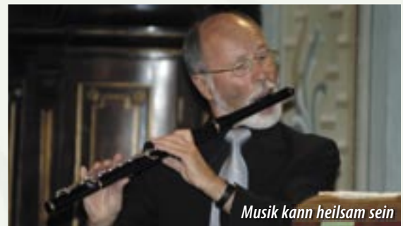
Musik kann heilsam sein

lich geregelt. An der Fachhochschule Krems werden ab diesem Herbst 20 Studienplätze für die Ausbildung zum Musiktherapeuten angeboten.