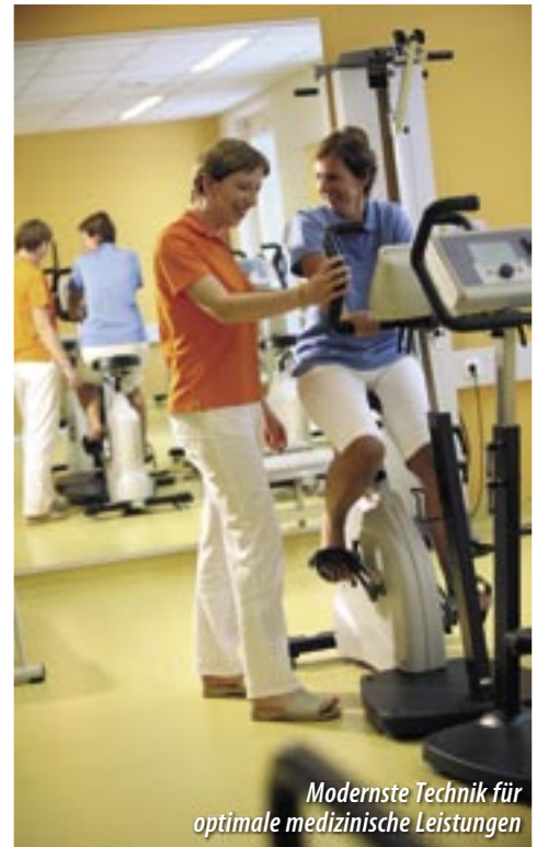
Modernste Technik für optimale medizinische Leistungen

zu errichten, über die ersten Jahre, als es noch wirtschaftliche Anlaufschwierigkeiten gab, bis zum heutigen Tag, an dem der Theresienhof in jeder Hinsicht „etabliert“ sei. Als Pünktchen auf dem „i“ enthüllte er das neue Logo im Foyer: „Theresienhof – Klinikum für Orthopädie und orthopädische Rehabilitation“.