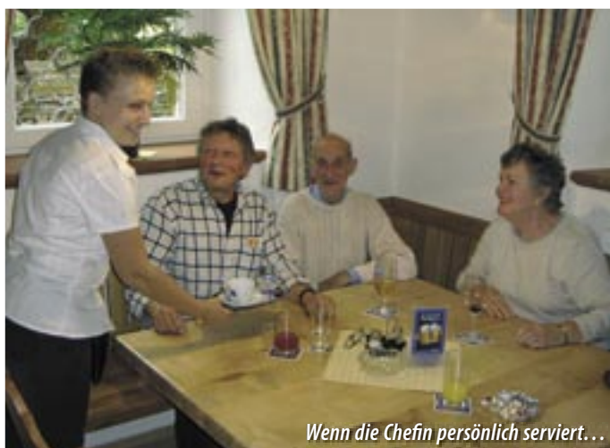
Wenn die Chefin persönlich serviert...

die Familien!“) am Sonntag. An Wochentagen wird ein preisgünstiges Menü angeboten – überhaupt will man sich mit den Preisen „den örtlichen Gegebenheiten anpassen“. Erfreut, dass wieder Leben in die Mauern des Schweizerhofs eingezogen ist, zeigt sich Gemeinderat Gerhard Hofer aus Laufnitzdorf: „Ein Dorf ohne Gasthaus ist nun einmal nicht das Richtige...“ Er will auch für einen guten Draht der Pächter zur Gemeindeverwaltung sorgen. Geöffnet ist der Schweizerhof von Dienstag bis Sonntag jeweils von 10 bis 23 Uhr, warme Speisen werden von 11.30 bis 21 Uhr serviert. Telefonisch erreichbar ist der Gasthof Schweizerhof unter 03126 / 51199.